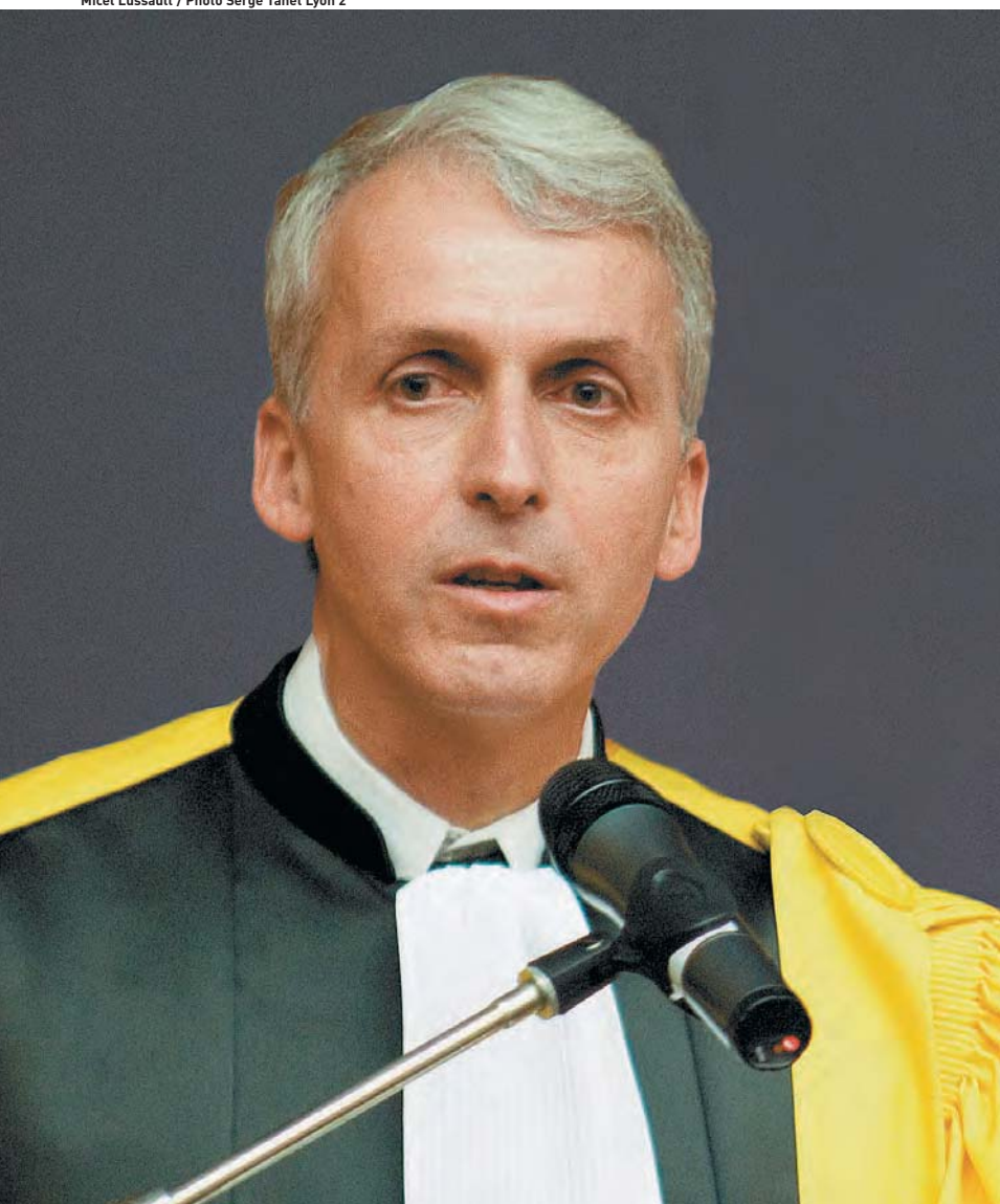
Michel Lussault / Photo Serge Tanet Lyon 2

Retrouvez l'intégralité du message du Président LUSSAULT sur la page d'accueil du site de l'Université de Lyon : www.universite-lyon.fr