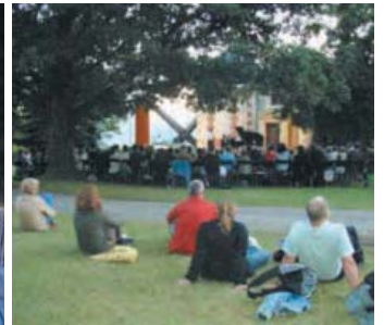
Projets scolaires dans le cadre de l'AMA09