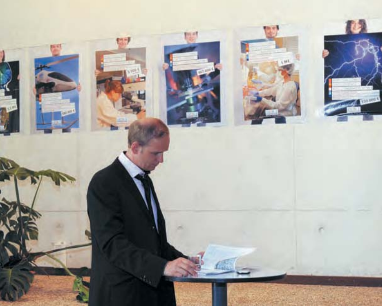
Soirée de lancement du club d'entreprises partenaires de la Fondation Lyon 1