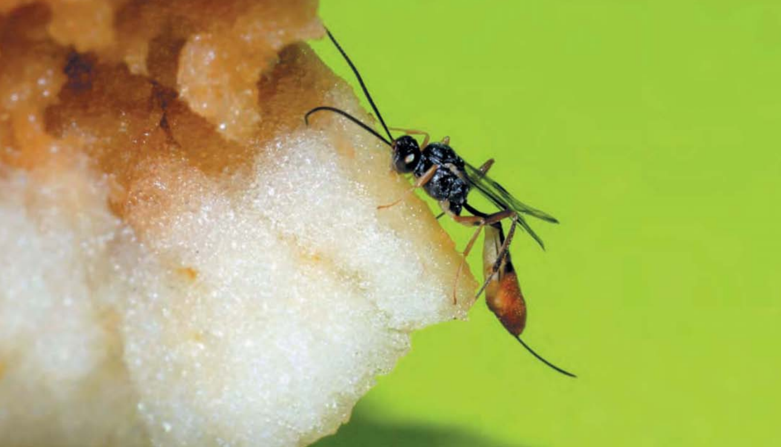
Femelle de l'hyménoptère parasitoïde