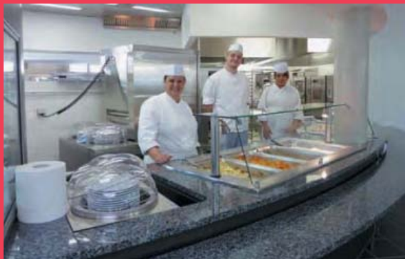
Le nouveau restaurant de Rockefeller